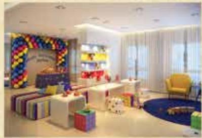
Perspectiva ilustrada do salão de festas infantil

ACESSE PELO QR CODE E SAIBA COMO CHEGAR: