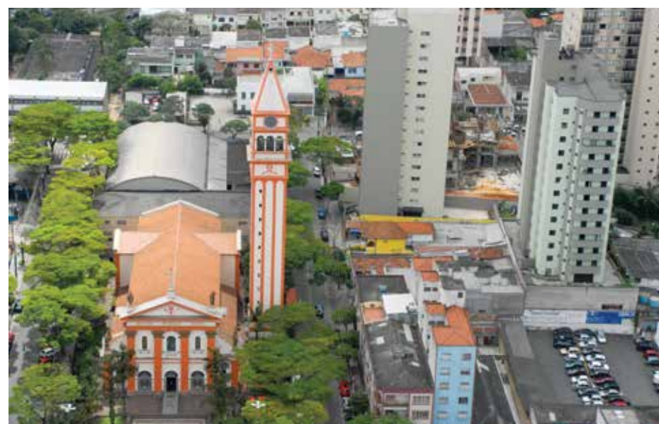
Igreja Matriz: exemplo do cuidado da cidade com sua história.

Um dos investimentos recentes que vem trazendo mais qualidade de vida e conveniência aos seus moradores foi a ampliação do tradicional Shopping Metrôpole, que ganhou uma nova alameda de serviços. A área ganhou 12 operações, entre lotérica, casa de câmbio, esmalteria, caixas eletrônicos e novas lojas de suplementos e games. Além disso, um espaço de 1.500 m 2 abrange a primeira unidade da academia Bio Ritmo da região.