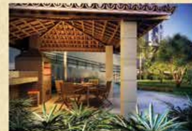
Perspectiva ilustrada da churrasqueira