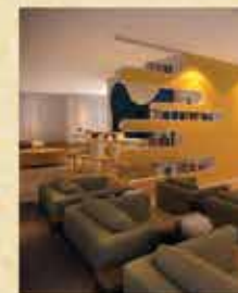
Perspectiva ilustrada do h...