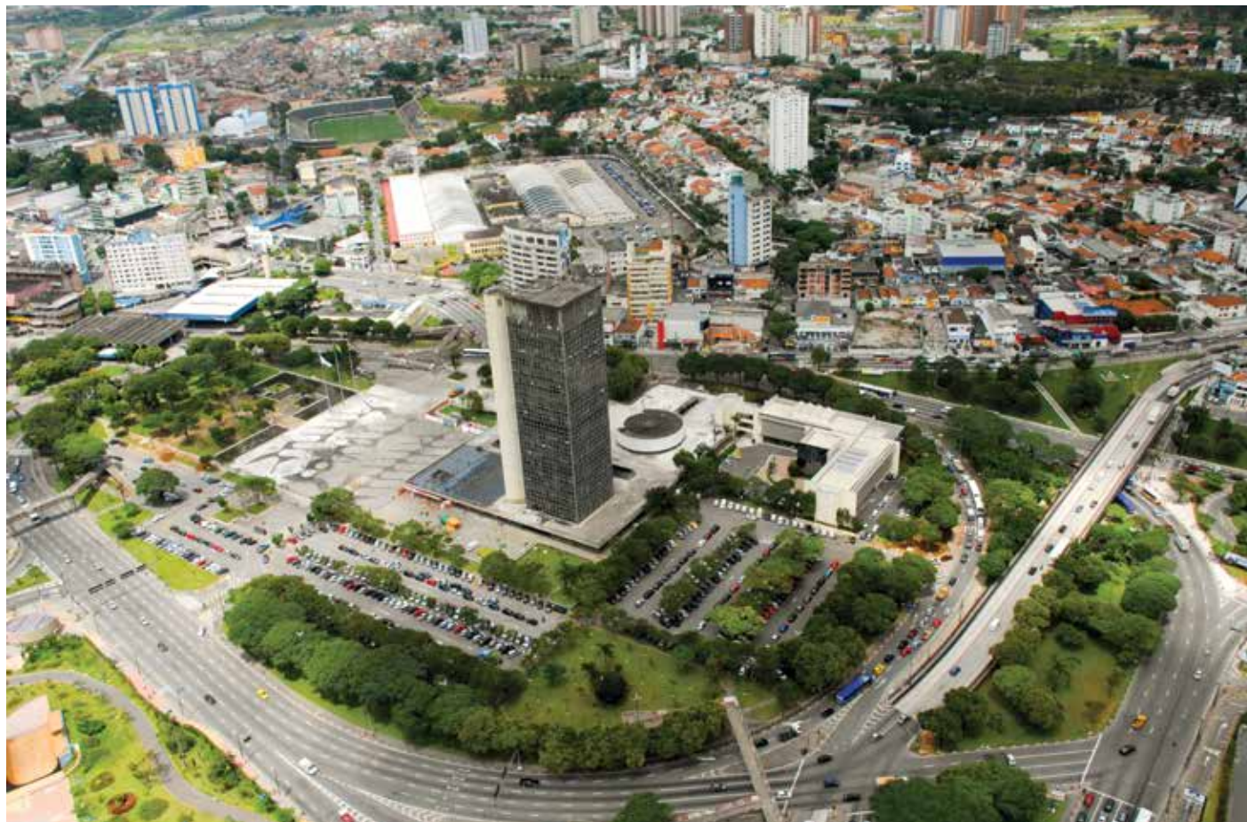
Paço Municipal de São Bernardo do Campo, uma das atrações do município.

Morar em São Bernardo, acima de tudo, representa uma opção inteligente para quem busca qualidade de vida. É uma cidade moderna, altamente industrializada e que não para de crescer. Distante somente 22 quilômetros da capital, o município é a quarta cidade mais rica do estado e conta com cerca de 800 mil habitantes, segundo dados do IBGE (Instituto Brasileiro de Geografia e Estatísticas).